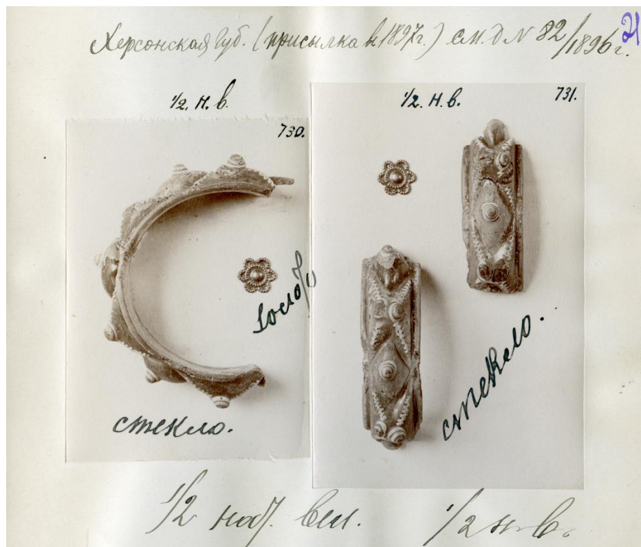
Рис. 3 Стеклоый браслет, склеенный из двух фрагментов и золотая нашивная бляшка в виде розетки, приобретенные у Лейбы Гохмана в 1897 г. РО НА ИИМК РАН. Ф. 1. Оп. 1. 1896. Д. 82. Л. 21.