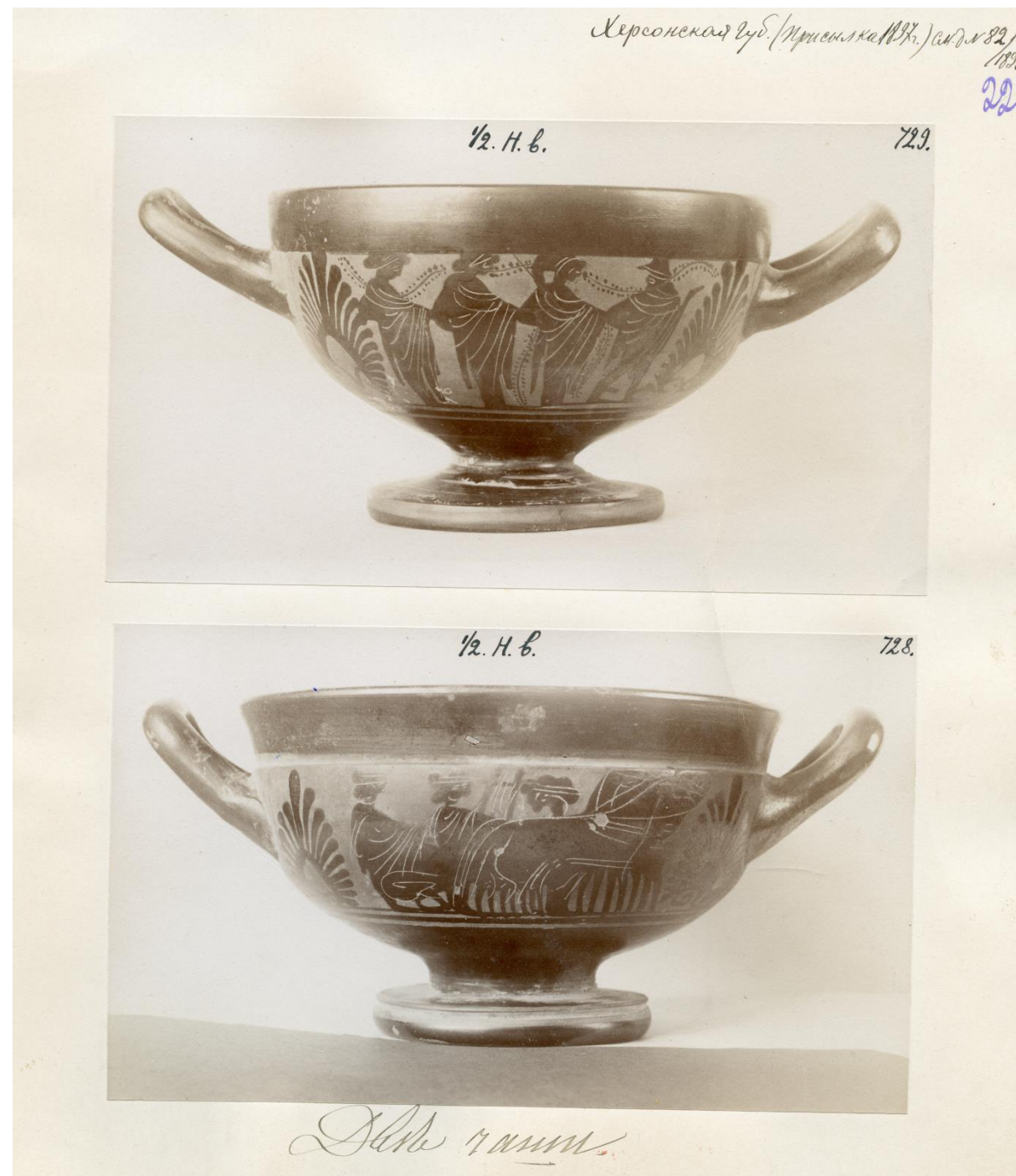
Рис. 4 Два чернофигурных скифоса, приобретенные у Лейбы Гохмана в 1897 г. РО НА ИИМК РАН. Ф. 1. Оп. 1. 1896. Д. 82. Л. 22.