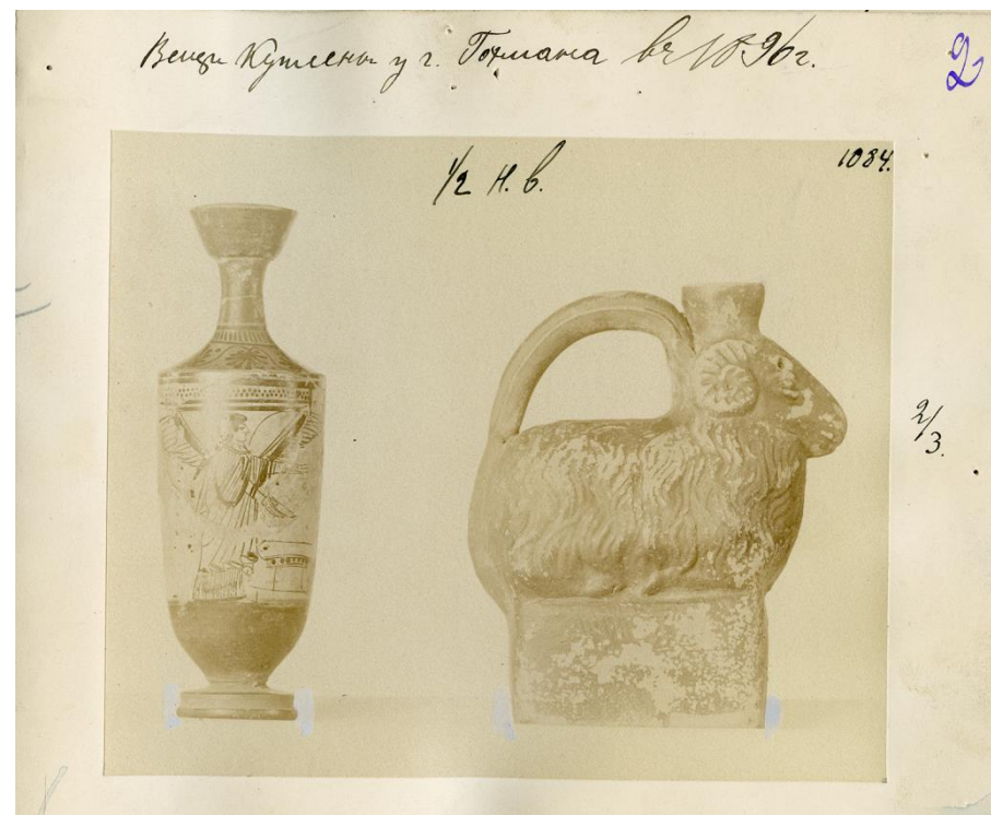
Рис. 2 Чернофигурный лекиф и фигурный аск в виде барана, приобретенные у Леона Гохмана в 1896 г. РО НА ИИМК РАН. Ф. 1. Оп. 1. 1896. Д. 82. Л. 2.