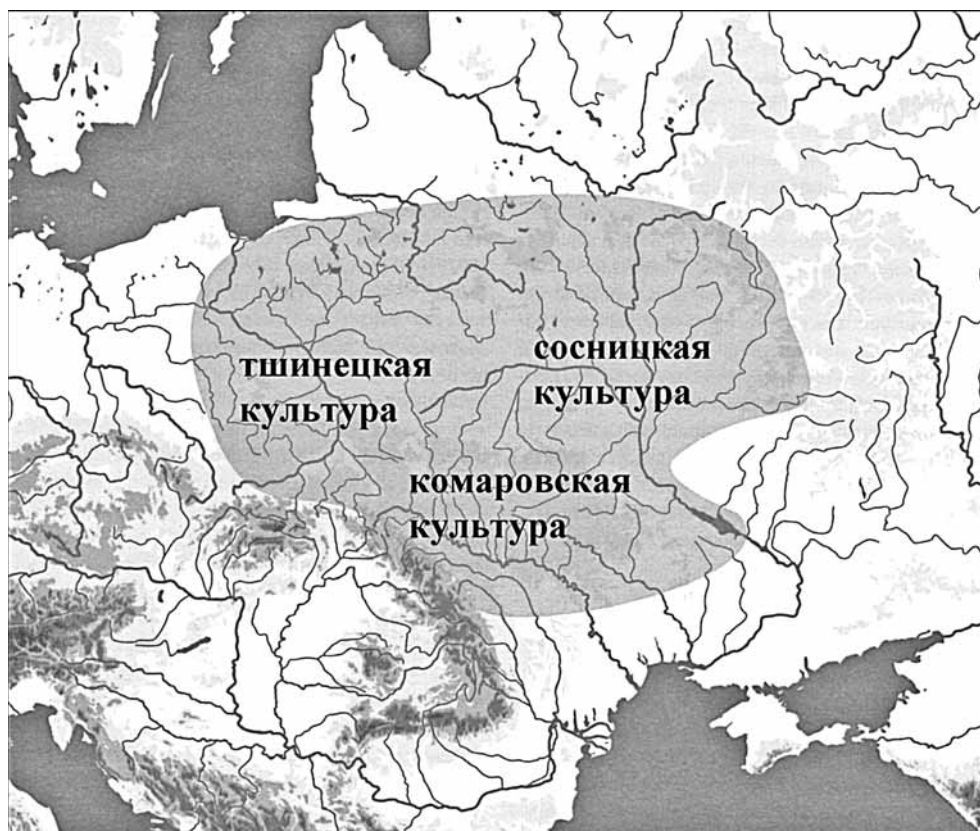
Рис. 1. Тшинецкий культурный круг (по Makarowicz 2010) с обозначенными тшинецкой, комаровской и сосницкой культурами.