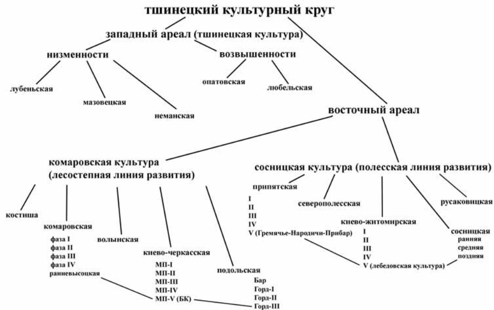
Рис. 2. Структура тшинецкого культурного круга.