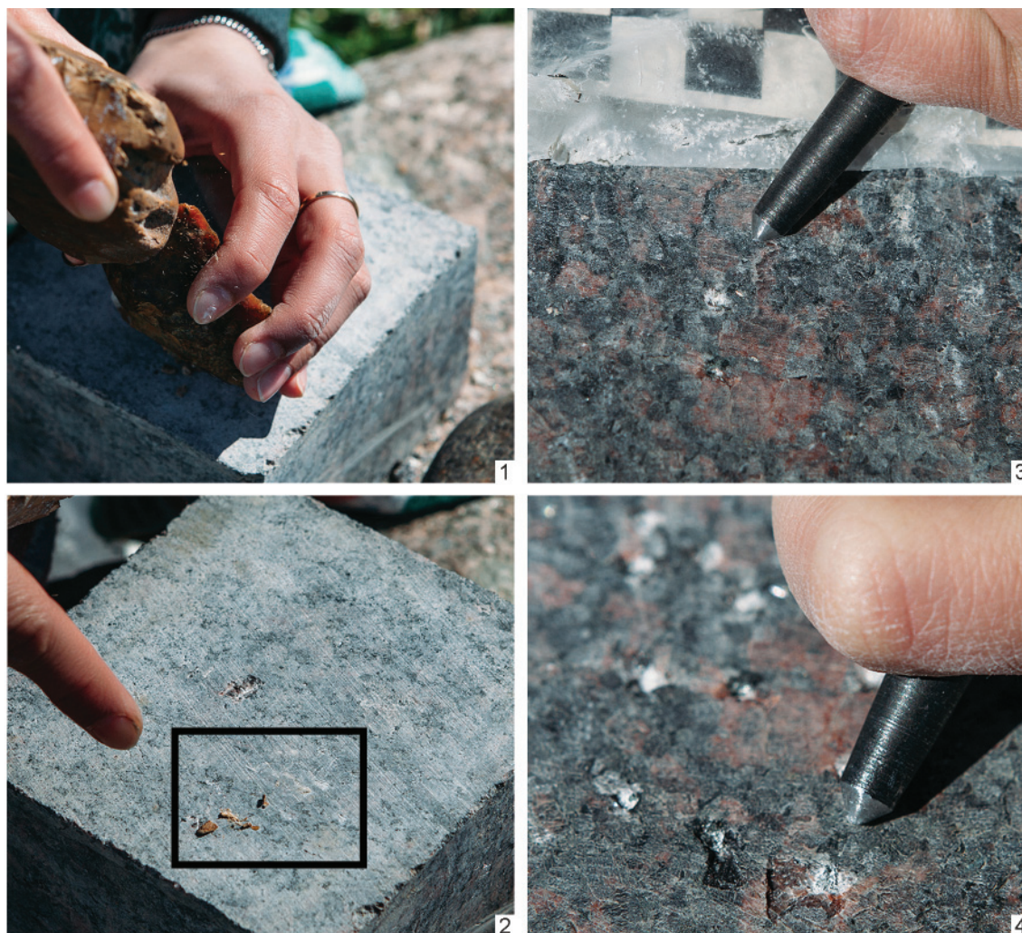
Рис. 2. Эксперименты: 1, 2 — «кремень по граниту»; 3, 4 — «сталь по граниту»

Fig. 2. Experiments: 1, 2 — «flint on granite»; 3, 4 — «steel on granite»