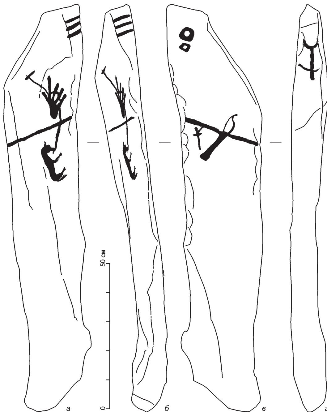
Рис. 1. Могильник Ховужук-Аксы (Овьурский р-н, Республика Тыва), олений камень № 9 Fig. 1. Khovuzhuk-Aksy cemetery (Ovyur district of the Republic of Tuva), deer stone No. 9

с пятью отростками (пальцами). Верхняя часть камня имеет небольшой выступ и как бы нависает над ожерельем. На боковой, по всей видимости, левой стороне сверху расположены серьга с круглой подвеской и ожерелье (цепочка овальных лунок).