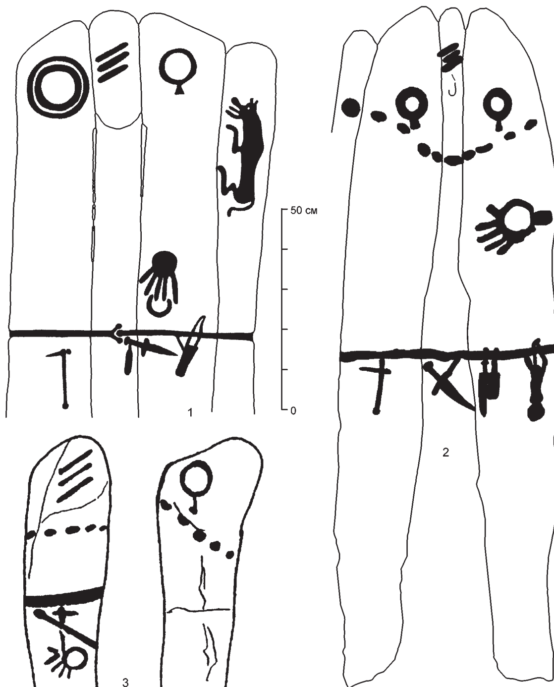
Рис. 2. Оленные камни с изображением руки из Тувы: 1 — поселок Аржаан (по: Марсадолов 2005); 2 — Чинге-Тей 1 (по: Чугунов 2014); 3 — Уюк (по: Кызласов 1978; без масштаба)