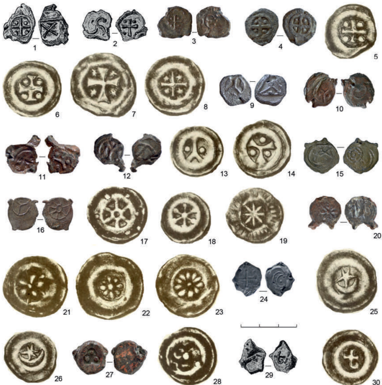
Рис. 3. Пломбы и «пуговичные» брактеаты с изображениями креста с четырьмя точками и различных символов, XIII в.: 1, 2, 29 — Дрогичин, Польша (Болсуновский, 1894. Табл. IV, 151, 133, Табл. II, 61); 3, 4, 9–12, 15, 16, 20, 24, 27 — Чермно, Польша (Florkiewicz et al., 2020. № II.30, МТ/1318/1/А; NN.81, МТ/1676/18/А; II.114, МТ/1264/А; NN.535, МТ/1676/55/А; NN.516, МТ/1676/101/А; NN.529, МТ/1676/118/А; NN.280, МТ/1704/51/А; NN.281, МТ/1676/97/А; I.44, МТ/1805/18/А; II.33, МТ/1454/1/А; NN.294, МТ/1676/71/А); 5–8, 13, 14, 17–19, 21–23, 25, 26, 28, 30 — Веленьский клад, Польша (Beyer, 1876. Tab. I, 11, 12, 14, 15, 16; Tab. I, 1, 2; Tab. II, 59; I: 34, 35; Tab. I, 32–34; Tab. II, 36, 37; Tab. II, 66; Tab. I, 40)