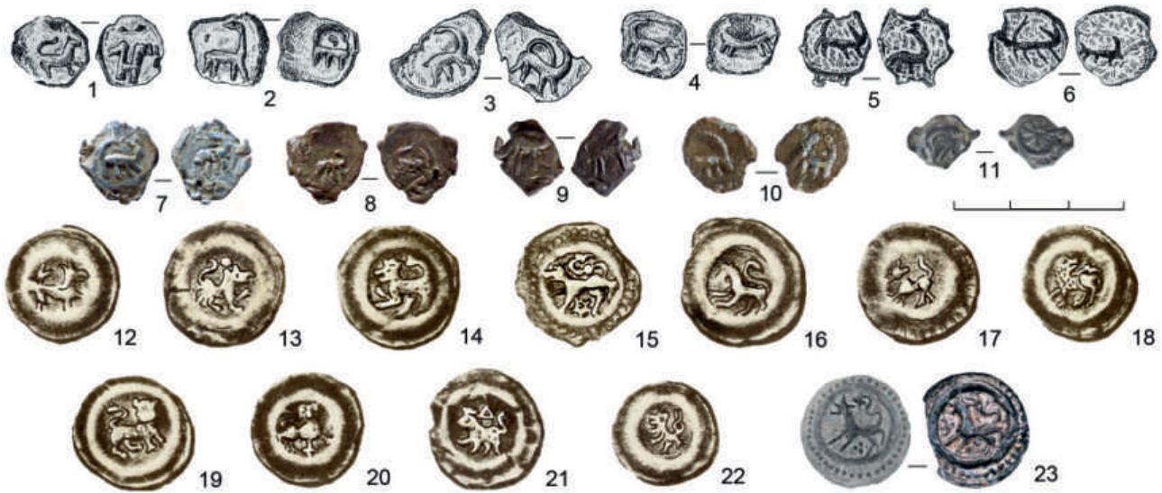
Рис. 2. Пломбы и «пуговичные» брактеаты с изображением геральдического зверя, XIII в.: 1–6 — Дрогичин, Польша (Болсуновский, 1894. Табл. V, 188–191; XVIII, 839–840); 7–11 — Чермно, Польша (Florkiewicz et al., 2020. № NN.201, МТ/1676/3/А; NN.202, МТ/1676/21/А; NN.203, МТ/1676/33/А; NN.204, МТ/1676/12/А; NN.205, МТ/1676/35/А); 12–22 — Веленьский клад, Польша (Beyer, 1876. Tab. V, 183–193); 23 — Радзановский клад, Польша (Milejski i in., 2017a. Рис. 4b)