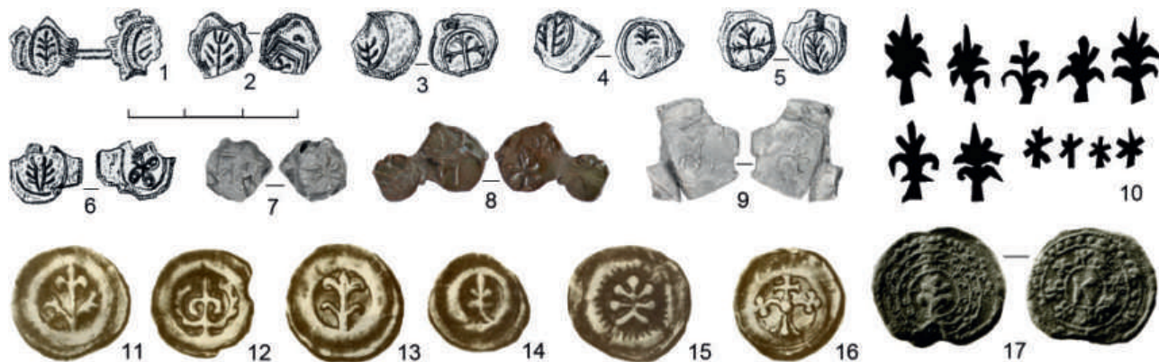
Рис. 4. Изображение растительного мотива на пломбах, брактеатах, печатях и византийских тканях, XII–XIV вв.: 1–6 — Дрогичин, Польша (Болсуновский, 1894. Табл. XIX, 898; V, 168–172); 7–9 — Чермно, Польша (Florkiewicz et al., 2020. № NN.200, МТ/1912/226/А; NN.197, МТ/1676/13/А; NN.198, МТ/1912/260/А); 10 — облачение византийского императора Алексея I Комнина на книжной миниатюре (Biblioteca Apostolica Vaticana, Gr. 666, f.2r); 11–16 — Веленьский клад, Польша (Beyer, 1876. Tab. III, 81–85, 88); 17 — печать из коллекции Н. Лихачева (Лихачев, 1930. Рис. 47)