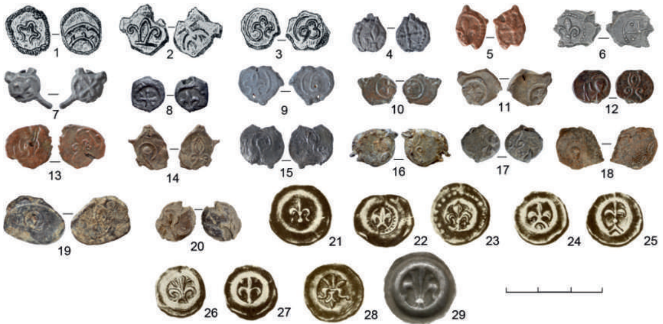
Рис. 5. Пломбы и «пуговичные» брактеаты с изображениями геральдической лилии, XIII в.: 1–3 — Дрогичин, Польша (Болсуновский, 1894. Табл. IV, 159, 160, 164); 4–20 — Чермно, Польша (Florkiewicz et al., 2020. № П.32, МТ/1468/3/А; NN.76, МТ/1676/20/А; NN.77, CZ/4/15; NN.78, MN/1921/17/А; NN.79, МТ/1676/31/А; II.110, МТ/1370/1/А; NN. 265, МТ/1676/37/А; NN. 266, Cz/44/15; I.2, МТ/1734/1/А; NN.5, МТ/1676/36/А; NN.6, МТ/1676/26/А; NN.7, МТ/1912/17/А; NN.8, МТ/1912/15/А; NN.9, МТ/1912/68/А; NN.10, Cz/37/15; NN.11, Cz/45/15); 21–28 — Веленьский клад, Польша (Beyer, 1876. Tab. II, 69–75; VI, 211); 29 — Польша (Milejski i in., 2017b. Ryc. 5, j)