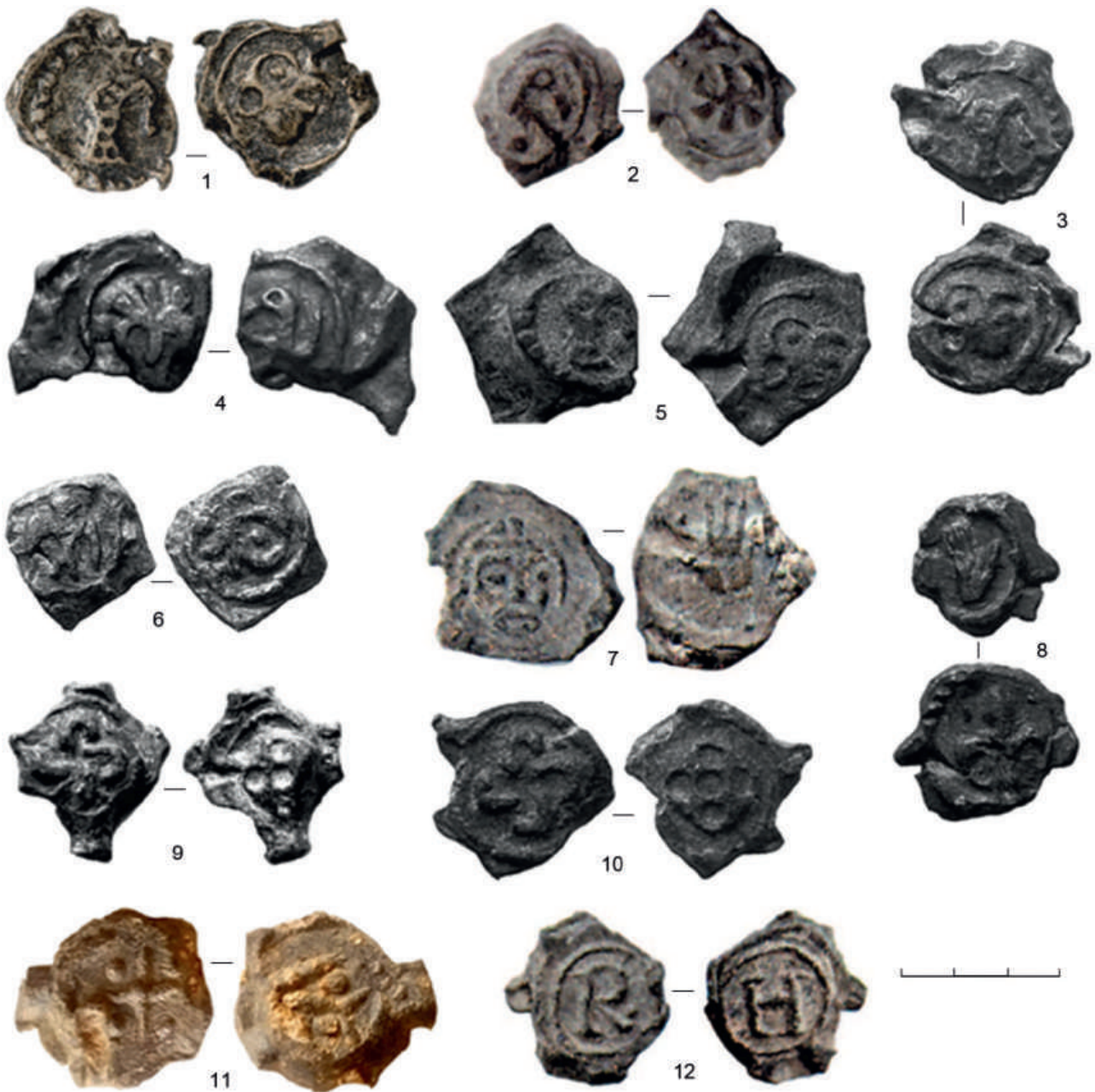
Рис. 6. Польские свинцовые пльомбы на территории Мазовецкой и Сандомирской земли, XIII в.: 1 — Насельск ( Błoński, Bogucki, 2019. Fig. 2, 1 ); 2, 7, 12 — Пльок ( Trzeciecki, 2019. Fig. 2, 2, 6, 4 ); 3–6, 8–10 — Пултуск ( Jakubowska, 2019. Fig. 3, 6; 4, 3, 4; 3, 1, 7; 5, 1, 4 ); 11 — Пьотрўвка (Радом) ( Trzeciecki i in., 2020. Tab. 116, 2 )