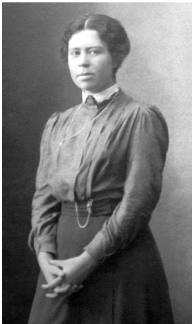
Рис. 2. Н. А. Энман. Высшие женские (Бестужевские) курсы. Санкт-Петербург, 1910 г. (Руднева, 2007. С. 125)