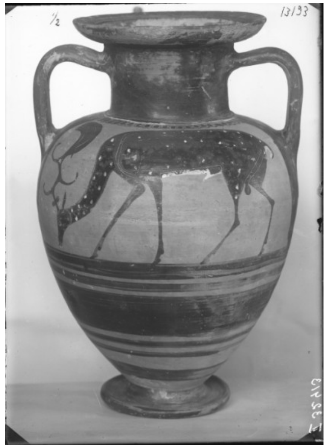
Рис. 3. Расписная амфора, найденная на Таманском полуострове (НА ИИМК РАН. ФО. Негатив П32413)

В 1911 г. выходит ее первая статья, посвященная хиосскому или, как тогда полагали, «навкратийскому» кубку из раскопок Г. Л. Скадовского 1900–1901 гг. на некрополе о. Березань ( Энман , 1911. С. 142–158). Эта работа с интересом читается и в наше время. Она содержит подробное и полное описание сосуда, предложенная автором датировка близка современной ( Ильина , 2005. С. 91). В следующем году вышла вторая статья «Ионийская амфора с Таманского полуострова» ( Энман , 1912. С. 92–103), посвященная клазоменской амфоре с изображением пасущегося оленя (рис. 3), купленной Комиссией