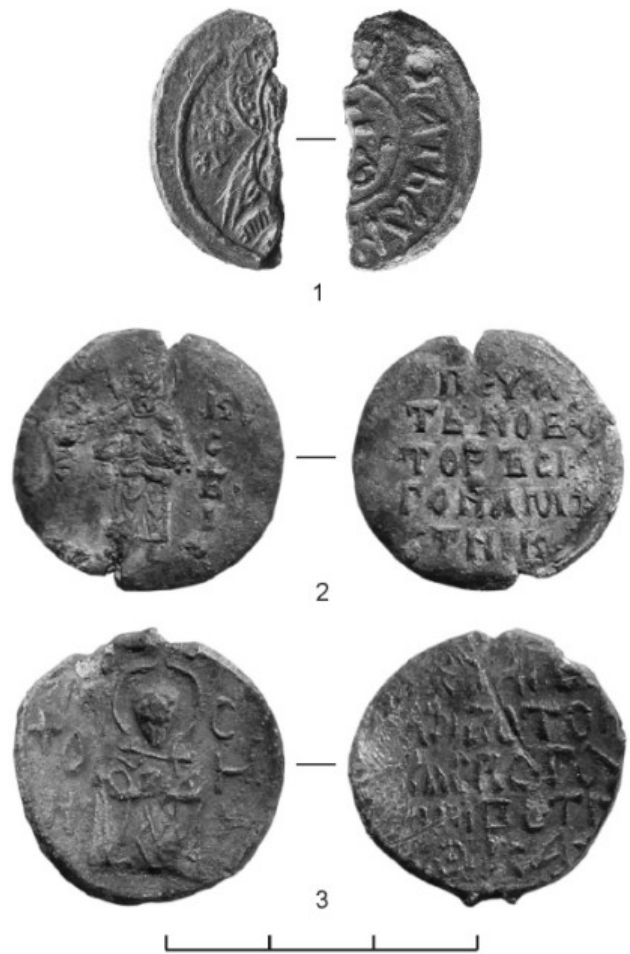
Рис. 3. Актовые печати, зарегистрированный в 2019 г. на Ржевском городище «Соборная гора»: 1 — Плотницкий конец Великого Новгорода; 2, 3 — новоторжские наместники