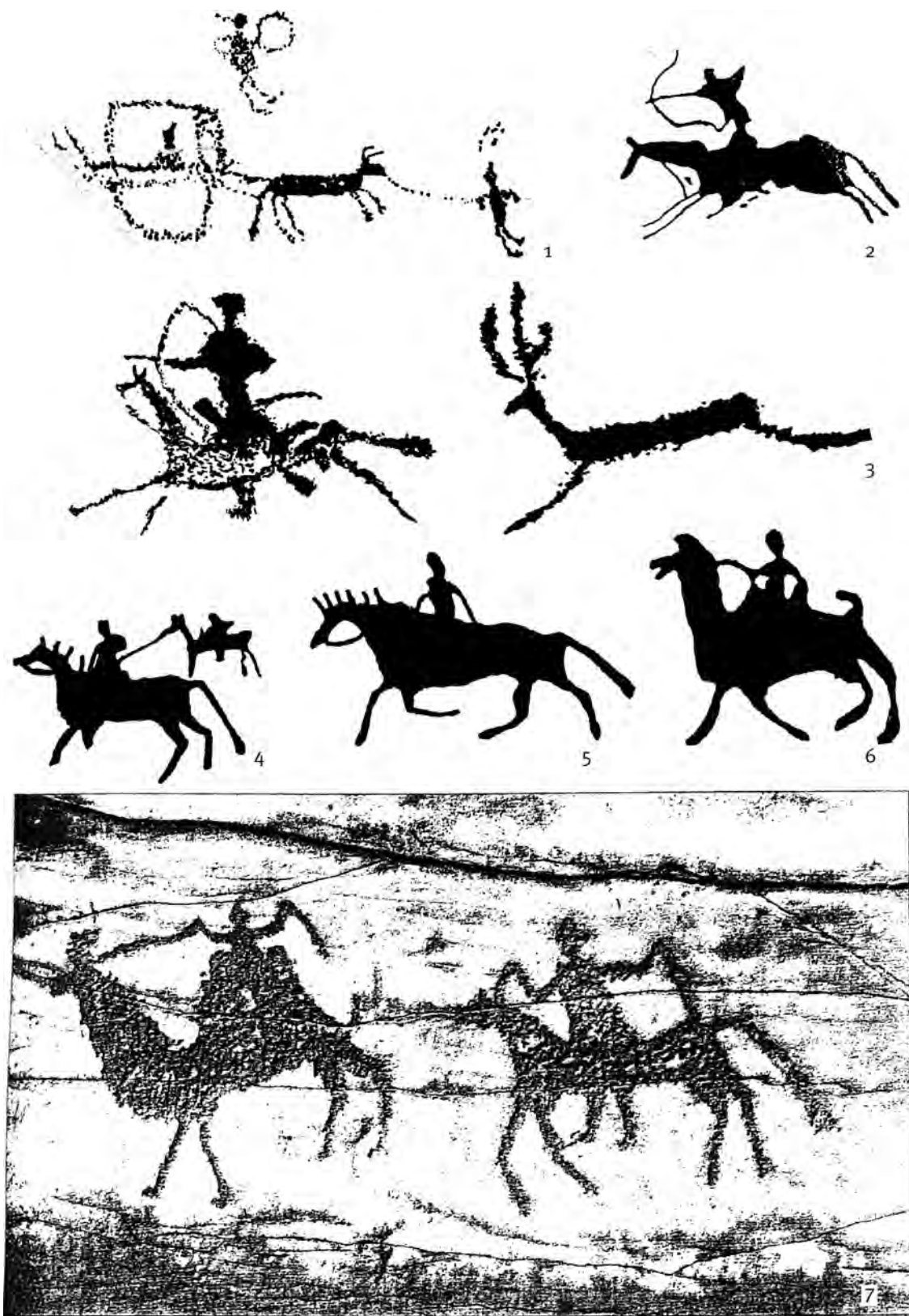
Рис. 2. Наскальные изображения местонахождения Улазы (Леонтьев и др., 2012) Fig. 2. Rock representations at the site of Ulazy (Леонтьев et al., 2012)