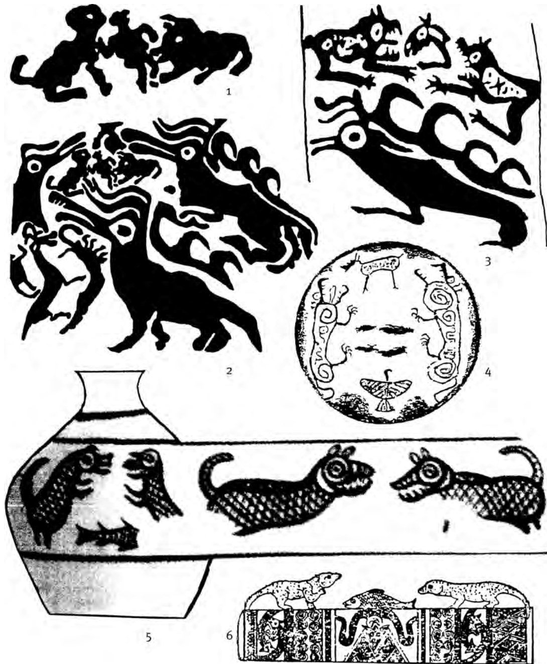
Рис. 2. Сцены с двумя хтоническими хищниками. 1, 2 – из Сууюкоу (уезд Хэлань); 3 – из Ушкийн-Увэра (Хубсугульский аймак, Монголия); 4 – из Шанцуньлина (пров. Хэнань); 5 – из Дадивань (уезд Циньань, пров. Ганьсу); 6 – из Шичжайшань (пров. Юньнань). 1–3 – наскальные изображения; 4, 6 – бронза; 5 – керамика. Масштабы разные. Масштабирование рисунков и компоновка таблицы выполнены А. В. Вареновым (1, 2 – Гай Шаньлин, Гай Чжэхао, 2002. С. 408; 3 – Nowgorodowa, 1980. P. 178; 4 – Дуань Шуань, 2005. С. 4; 5 – прорисовка по фотографии, сделанной А. В. Вареновым в Музее пров. Ганьсу; 6 – Пилацзоли, 1990. С. 81)

Fig. 2. Scenes with two chthonic predators. 1, 2 – from Suyukou (Helan county); 3 – from Ushkijn-Uver (Khövsgöl aimag, Mongolia); 4 – from Shangcunling (Henan province); 5 – from Dadiwan (Qingan county, Gansu province); 6 – from Shizhaishan (Yunnan province). All figures are of different scales. The size of individual figures and composition of plate are designed by A. V. Varenov (1, 2 – Гай Шаньлин, Гай Чжэхао, 2002. С. 408; 3 – Nowgorodowa, 1980. P. 178; 4 – Дуань Шуань, 2005. С. 4; 5 – drawing after photo made by A. V. Varenov in Gansu provincial museum; 6 – Пилацзоли, 1990. С. 81)