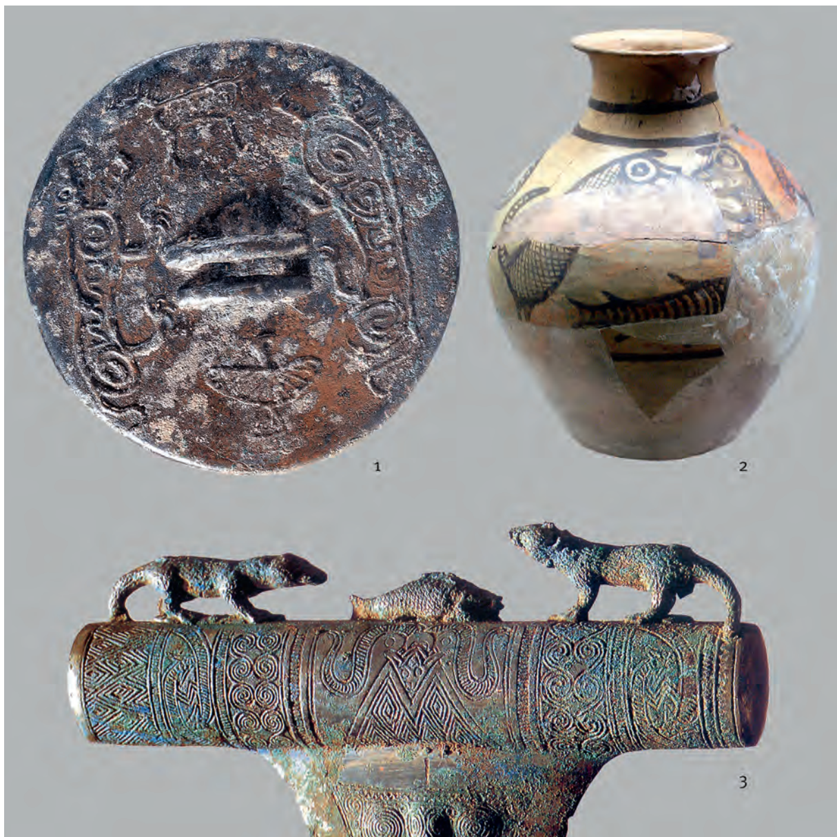
Рис. 5. Сцены с двумя хтоническими хищниками. 1 – из Шанцуньлина (пров. Хэнань); 2 – из Дадивань (уезд Цинъянь, пров. Ганьсу); 3 – из Шичжайшань (пров. Юньнань). 1, 3 – бронза, 2 – керамика. Масштабы разные. Масштабирование рисунков и компоновка таблицы выполнены А. В. Вареновым (1 – Дуань Шуань, 2005. С. 6; 2 – из музея пров. Ганьсу; 3 – Чжан Дуньшэн, 1993. С. 88)

Fig. 5. Scenes with two chthonic predators. 1 – from Shangcunling (Henan province); 2 – from Dadiwan (Qingan county, Gansu province); 3 – from Shizhaishan (Yunnan province). All figures are of different scales. The size of individual figures and composition of plate are designed by A. V. Varenov (1 – Дуань Шуань, 2005. С. 6; 2 – from Gansu provincial museum; 3 – Чжан Дуньшэн, 1993. С. 88)