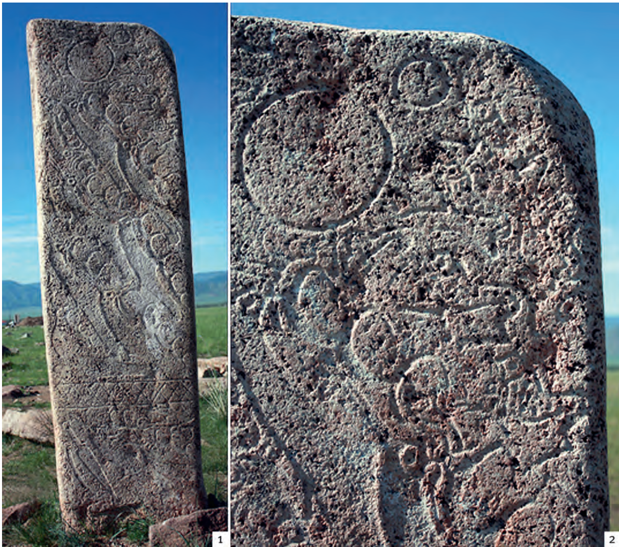
Рис. 4. Олений камень № 4 из Ушкийн-Увэра (Хубсугульский аймак, Монголия): 1 – общий вид; 2 – деталь с хищниками, преследующими коня.