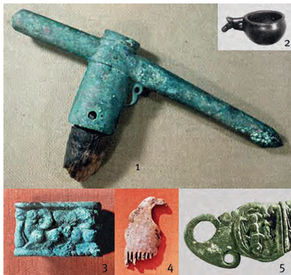
Рис. 3. Сибирская археологическая экспедиция Ленинградского Дворца пионеров. Вещи из раскопок в 1976–1977 гг. Могильник Усть-Хадынныг I. 1 – чекан; 2 – вотивный сосуд; 3 – обкладка пояса; 4 – гребень с изображением «головы птицы»; 5 – поясная пряжка. 1–3, 5 – бронза; 4 – рог / кость. Масштаб разный.

Вернувшись в Ленинград, спешу к Александру Даниловичу. Начинаю выкладывать чертежи, находки. Он ходит кругами, ахает, причмокивает, то и дело восклицает: «Ай да пионеры!» Когда дело