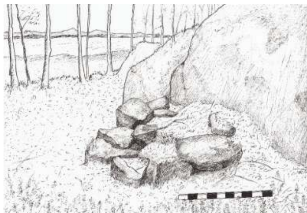
Рис. 5. Каменное сложение Табойпорог II

Визуально, без раскопок, точно определить функциональное назначение и тем более культурную принадлежность и датировку конкретной