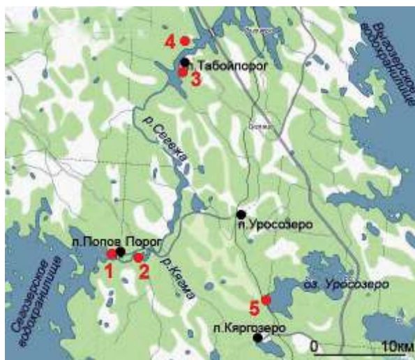
Рис. 2. Памятники археологии Восточного Сегозерья: 1 – стоянка Попов Порог I; 2 – стоянки Сегоже I–VII; 3 – каменные кучи Табойпорог II, III; 4 – углежогная куча Табойпорог I; 5 – стоянка Уросзеро I

в озеро рек Сегожа и Вожема, на ровных песчаных площадках первой береговой террасы, недалеко от воды, в 10–20 м, на высоте 1–3 м над уровнем водоема, имеют относительно небольшую площадь (от 400 до 1000 кв. м). Находки в шурфах (по 1 кв. м) стандартны: единичные орудия (скребки, отщепы с ретушью) и отходы производства (куски, отщепы, осколки) кварца, кремня, лидита и сланца, фрагменты кальцинированных косточек. Неолитическая керамика (сперрингс и ромбо-ямочная) встречена в шурфе (4 кв. м) только на поселении Сегожа V, где отмечена и жилищная впадина округлой в плане формы (диаметром 5 м, глубиной 0,3 м) (Жульников, 2003. С. 14. Рис. 4). Памятники предварительно датированы периодом неолит–энеолит (рис. 3).