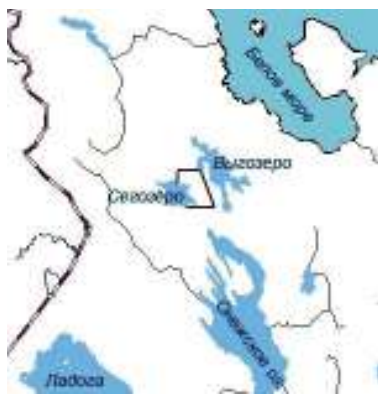
Рис. 1. Восточное Сегозерье

приходящиеся, в основном, на многочисленные пороги.