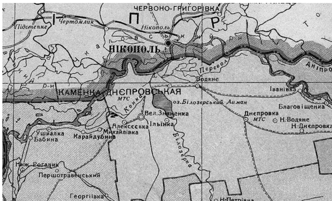
Рис. 1. Местонахождение могильника Мамай-Гора (с. В. Знаменка Каменско-Днепровского р-на Запорожской области). Фрагмент карты Запорожской области. 1949 год. Масштаб 1:300 000

Возвышенность Мамай-Гора расположена вблизи с. В. Знаменка Каменско-Днепровского района Запорожской области, на правом берегу Каховского водохранилища (рис. 1). До его создания у подножия господствующей высоты протекала р. Конка, периодически смыкающаяся с расположенной севернее р. Днепр.