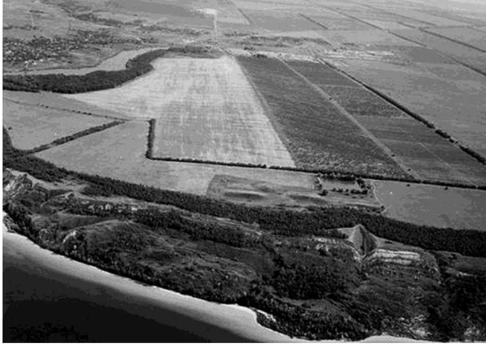
Рис. 2. Вид Мамай-Горы с северо-запада

Ядро могильника образовывали пять больших курганов, вытянутых по линии запад-восток, среди них три длинных и два округлых (рис. 2, 3). Они, как и пространство между ними, никогда не подвергались распашке. По известным планам, видимые в рельефе насыпи концентрировались преимущественно к югу от ядра.