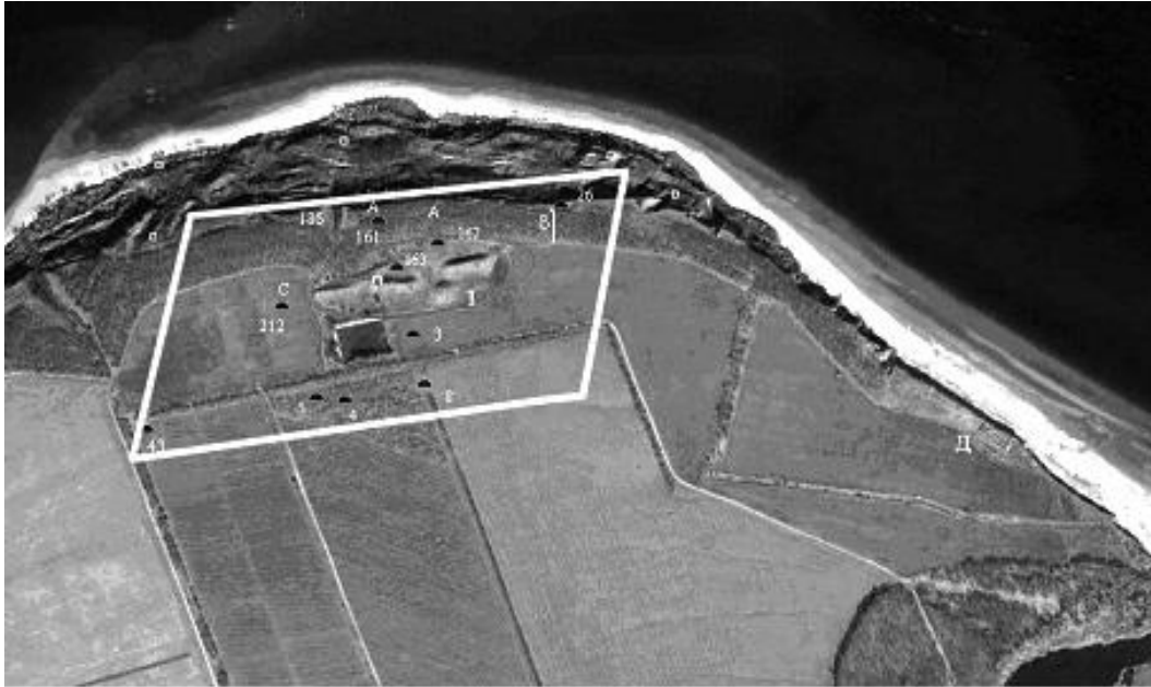
Рис. 4. Могильник Мамай-Гора (нанесены исследованные грунтовые могильники и рельефные курганы различных эпох)

Установлено, что высокий береговой выступ стал использоваться как могильник с эпохи неолита. Ряд захоронений (26) этого времени (рис. 4, литера Б ), расположенный перпендикулярно речной долине, выявлен в 200 м к востоку от ядра.