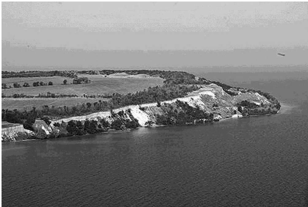
Рис. 3. Общий вид Мамай-Горы с востока

Ядро могильника образовывали пять больших курганов, вытянутых по линии запад-восток, среди них три длинных и два округлых (рис. 2, 3). Они, как и пространство между ними, никогда не подвергались распашке. По известным планам, видимые в рельефе насыпи концентрировались преимущественно к югу от ядра.