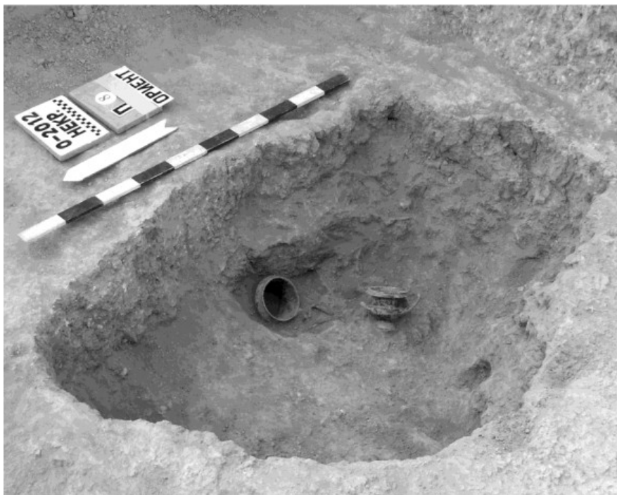
Рис. 1. Погребение № 8/2012 Ольвийского некрополя, канфары во входной яме

Находки первой группы являются следствием поминальных ритуалов, которые исполнялись непосредственно после совершения захоронения. Как правило, лучше всего объекты этой группы фиксируются в подбойных могилах. Хорошим примером в данном случае является подбойное захоронение № 8 2012 г (Ивченко, 2012).