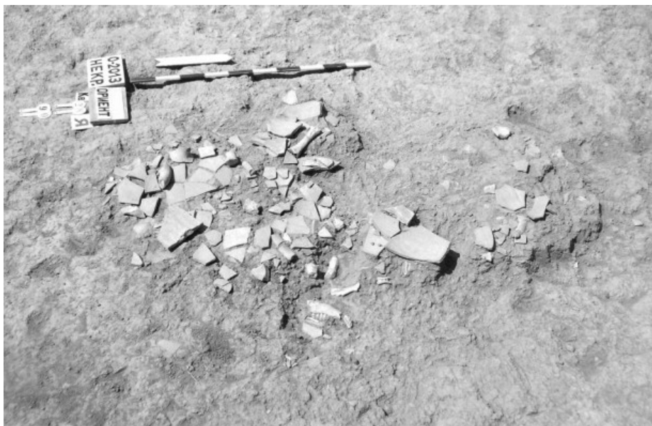
Рис. 3. Ольвия, раскоп «Ориент», скопление керамики

Данное захоронение также было найдено полностью непо потревоженным. При его рассмотрении на себя обращают внимание два момента. Во-первых, размещение фрагментов килика только в западной части входной ямы, но при этом по всей глубине ее заполнения. Во-вторых, несоответствие даты килика (а он относится к концу VI — первой половине V в. до н. э.) дате самого захоронения, которое благодаря наличию сетчатого лекифа, не может датироваться ранее, чем первой третью IV в. до н. э. Учитывая многочисленные следы ремонта на килике, можно предположить использование в поминальном ритуале долго и тщательно хранившейся, но полностью утратившей свое утилитарное значение посуды.