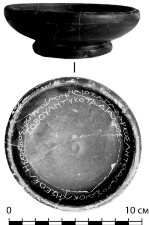
Рис. 4. Ольвия, раскоп «Ориент», чаша с граффито

Русяева А. С. Ивченко А. В. Новое граффито из некрополя Ольвии // Боспорские исследования. Симферополь; Керчь, 2014. Вып. XXX.