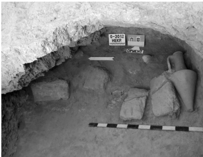
Рис. 2. Погребение № 8/2012 Ольвийского некрополя, заклад

Погребение сохранилось in situ . Сопровождавший покойного инвентарь, найденный непосредственно в подбое (краснофигурный лекиф с пальметтами, чернолаковый килик со штампованным орнаментом на внутренней части дна, бронзовая монета, зафиксированная в правой руке костяка), дает основание датировать данное захоронение последней четвертью IV — началом II вв. до н. э. (краснофигурный лекиф с пальметтами, относящийся ко второй половине IV в. до н. э., является самой ранней находкой из встреченного здесь материала).