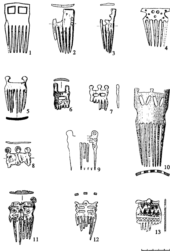
Рис. 1. Гребни из карасукских погребений (1 – Байкалова-II, м. 1; 2 – Кюргенер-I, к. 15; 3 – Мохов-I, об. 6; 4 – Черновая-VII, к. 2, м. 1; 5 – Варча-I, к. 8, м. 2; 6 – Малые Копены-III, к. 40, м. 1; 7 – Белый Яр-V, о. 68; 8 – Кюргенер-I, к. 6; 9 – Новый Белоаярск, к. 24; 10 – Сухое Озеро-II, к. 60; 11 – Малые Копены-III, к. 14, м. 3; 12 – Медведка, к. 17; 13 – Июсский, к. 7, м. 2). 2, 7, 13 – рог, остальное – кость

К большому и емкому по своему смыслу понятию гребней на сегодняшний день авторы раскопок относят 18 изделий, происходящих из погребений, и две находки из материалов поселения Торгажак, относящихся к карасукской культуре (рис. 1 и 2). Они могут быть разделены на две принципиально различающиеся по своим свойствам группы. Критерий отличия – назначение. Изделия первой группы относятся к разряду украшений (рис. 1). Предметы, объединенные во вторую группу, заметно отличаются по своим внешним признакам и техническим характеристикам, что позволяет считать их скорее орудиями труда, которые на основе этнографических параллелей могут быть названы чесалами (рис. 2). Учитывая принципиальную разницу в назначении и, как следствие, в использовании, рассматривать их необходимо по отдельности.